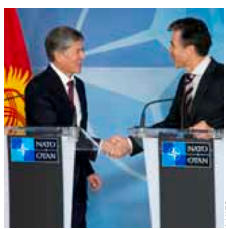
Президенти Қирғизистон Алмазбек Атамбоев ва Дабири Кулли НАТО Андерс Фог Расмуссен дар қароргоҳи НАТО 17 сентябри соли 2013 баъди мулоқоти дучониба анҷумани матбуотӣ доир карданд, ки дар доираи он масоили марбут ба амнияти минтақавӣ ва ҳамкории баъдина зимни баррасӣ қарор гирифт.

Тамоми панҷ мамлакатҳои Осиёи Марказӣ давраҳои аввал дар фаъолияти Шӯрои ҳамкории Атлантикаи Шимолӣ ширкат варзида буданд. Ин форум аз тарафи Иттиҳоди Атлантикаи Шимолӣ барои муқолима соли 1991 ба ҳайси қадами нахустин дар барҳам додани садди байни Шарқу Ғарб ва барпо кардани муносибатҳо бо мамолики аъзои собиқӣ Созишномаи Варшава барпо дода шуда буд. Дертар, соли 1997 ба ҷои ин ниҳод Шӯрои ҳамкории евроатлантикӣ