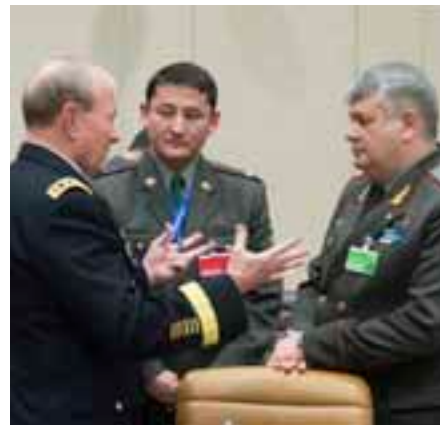
Генерал Мартин Демпси (Фармондеҳи штаби нерӯҳои ҳарбии ИМА) бо Генерал-майор Виктор Маҳмудов (ҳамонвақта фармондеҳи штаби нерӯҳои ҳарбии Ўзбекистон) ва подполковник Дилмурод Исакулов (намояндаи ҳарбии Ўзбекистон дар НАТО) ҳангоми вохӯрии 168-уми фармондеҳони штаб дар қароргоҳи олии НАТО дар моҳи январӣ соли 2013.