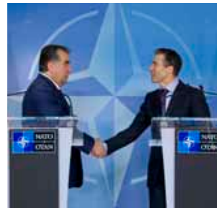
Президенти Тоҷикистон Эмомалӣ Раҳмон бо Дабири Кулли НАТО 10-апрели соли 2013 барои муҳокимаи ҷанбаҳои ҳамкорӣ дуҷониба, амнияти минтақавӣ ва мубориза зидди маводи муҳаддир мулоқот мекунад.

Қирғизистон барои рушди фаъолиятҳои ҳамкорӣ таваҷҷӯҳи бештари худро изҳор карда, соли 2007-ум розӣ шуд, ки дар барномаи Банақшагири ва ҷараёни таҳлили ШБС иштирок кунад. Баъди даргириҳои сиёсии соли 2010 ҳукумат ва парлумони нави Қирғизистон муносибатҳои худро бо НАТО аз нав тасдиқ намуданд. Қирғизистон бо таваҷҷӯҳи хоса барномаи мутобиқкунии иҷтимоӣ ва тақмили малакаҳои низомии захиравиро қабул намуда, барои амалӣ гардонии лоиҳаи Фонди мақсадноки НАТО–ШБС оид ба тақомули объектҳои нигоҳдошти силоҳи тирандозӣ ва силоҳи сабуку лавозимоти ҷангиро дархост намуд ва ҳамчунин нисбати дар шаҳри Бишкек кушодани дафтари НАТО тайёрии худро изҳор дошт.