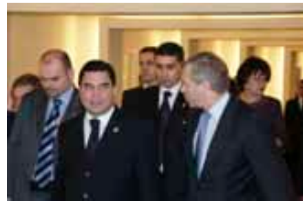
Президенти Туркманистон Гурбангулӣ Бердимухамедов ва Дабири Кулли собиқи НАТО Яап де Хооп Схеффер 7-ноябри соли 2007-ум дар қароргоҳи олии НАТО бо мақсади муҳокимаи ҳамкориҳои дучониба мулоқот мекунанд.

Бо нияти кӯмак ба ҷараёни машварату ҳамкорӣ тамоми панҷ шарик аз Осиёи Марказӣ дар қароргоҳи НАТО дар Брюссел (Белгия) намояндагҳои дипломатии худро таъсис доданд. Қазоқистон ва Қирғизистон дар Идораи ҳамкориҳои низомии