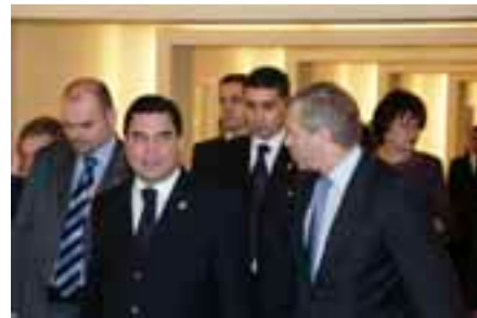
Turkmaniston Prezidenti Gurbanguli Berdimuxamedov va NATO sobiq Bosh kotibi Yaap de Xoop Sxeffer 2007 yil 7 noyabrda NATO shtab-kvartirasida ikki tomonlama hamkorlikni muhokama etish uchun uchrashdilar.

YAHK a’zolari muntazam ravishda keng doiradagi xavfsizlik masalalari, jumladan, birgalikdagi sa’y-harakatlar bilan NATO a’zo-davlatlari va sherik-davlatlaridan tinchlikparvar kontingentlari kiritilgan Kosovo va Afg’onistondagi xavfsizlik sharoitlari o’zgarishi yuzasidan fikr almashadilar. Bundan tashqari, YAHK terrorizmga qarshi kurash, chegaralar xavfsizligi, giyohvand moddalarning noqonuniy aylanuviga qarshi kurash va ommaviy qirg’in quroli, o’q otar qurolva yengil qurollanishning tarqashi bilan bog’liq boshqa masalalarga oid sohalar bo’yicha amaliy hamkorlikka ko’maklashish va muvofiqlashtirish, shuningdek bilim va ko’nikmalar bilan almashish bo’yicha tashabbuslarni ilgari surdi.