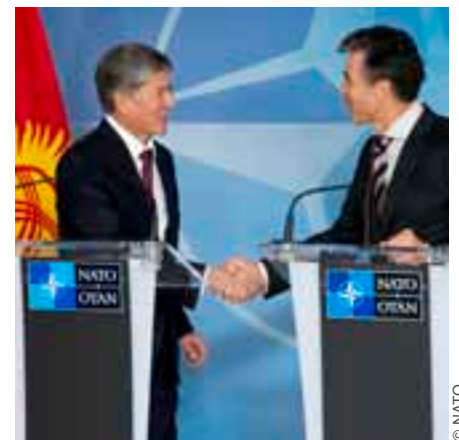
Qirg‘iziston Prezidenti Almazbek Atambaev va NATO Bosh kotibi Anders Fog Rasmussen mintaqaviy barqarorlik va keyingi hamkorlik masalalari muhokama etilgan ikki tomonlama uchrashuvdan so‘ng, 2013 y. 17 sentyabrda NATO shtab-kvartirasida qo‘shma matbuot anjumani o‘tkazishdi.

Markaziy Osiyodagi beshta davlat ilk davrdan Shimoliy atlantika hamkorlik Kengashida ishtirok etishni boshlaganlar. Ushbu forumga, Sharq va G‘arb o‘rtasidagi jarlikni yengib o‘tish va Varshava shartnomasiga kirgan sobiq davlatlar bilan o‘zaro aloqa o‘rnatish yo‘lidagi ilk qadam sifatida, muzokara olib borish uchun 1991 yilning dekabr oyida Shimoliy atlantika ittifoqi tomonidan asos solingan. Keyinroq, 1997 yilda, ushbu tashkilot o‘rniga yevroatlantika hamkorlik