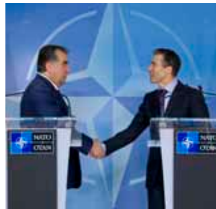
Tojikiston Prezidenti Emomali Raxmon NATO Bosh kotibi bilan, 2013 yil 10 aprelda ikki tomonlama hamkorlik, mintaqaviy xavfsizlik va narkotiklarga qarshi kurashni kuchaytirish maqsadida uchrashdi.

Qirg'iziston hamkorlik faoliyatining keyingi rivojiga katta qiziqish uyg'otmoqda va 2007 yilda TYH rejalashtirish va tahlil qilish Jarayonida ishtirok etishga rozilik bildirdi. 2010 yildagi siyosiy larzalar oqibatida yangi hukumat va Qirg'iziston parlamenti yana bir bor NATO davlatlari bilan munosabatlarni tasdiqladi. Qirg'iziston katta mamnuniyat bilan hozirda o'tkazilayotgan ijtimoiy moslashuv va istefoga chiqqan zaxiradagi harbiy xizmatchilarni qayta