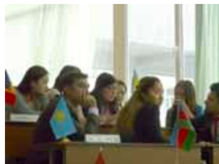
Al-Farobiy nomli Qozog‘iston milliy universiteti talabalari 2013 yilning noyabrida, NATO modellari anjumanidagi ishtiroklari. NATO axborot markazi tomonidan tashkil etilgan tadbir, NATO shtab-kvartirasining xalqaro xodimlari bilan videotelekonferensiya o‘tkazishni o‘z ichiga olgan.