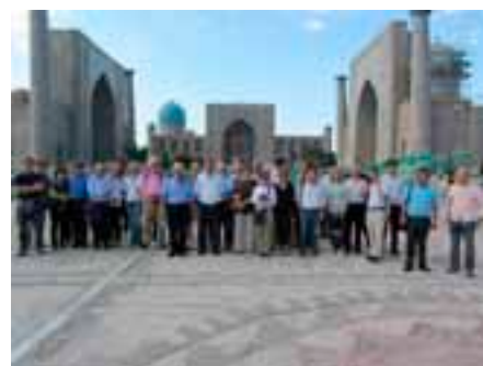
“Tinchlik va xavfsizlik yo‘lida ilm-fan” dasturi doirasida tabiiy ofat, inqirozni modellashtirish va barqaror rivojlanishni prognozlashtirish bo‘yicha simpozium ishtirokchilari. Simpozium 2013 yilning mayida, O‘zbekistonda, Samarqand shahrida o‘tkazilgan.

Markaziy Osiyodagi sheriklar bilan jamoatchilik diplomatiyasi sohasidagi hamkorlik Shimoliy atlantika ittifoqi va NATO bilan sheriklikning foydasi to‘g‘risidagi xabardorlikni oshirishga, shuningdek, jamoatchilik fikrini shakllantiruvchi asosiy shaxslarni, fuqarolik jamiyatini jalb etishga qaratilgan. Hozirda manfaatdor sherik-davlatlar bilan birga universitetlar, nodavlat tashkilotlari va Ommaviy Axborot Vositalari ishtirokidagi tarmoqlarni yaratish uchun hamkorlik amalga oshirilmoqda. Mahalliy muassasalar yoki nodavlat tashkilotlari NATO ko‘magida va davlat organlari bilan hamkorlikda seminarlar, konferensiyalar va simpoziumlar kabi turli tadbirlar o‘tkazishmoqda.