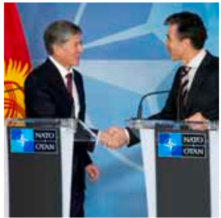
2013-nji ýylyň 17-nji sentýabrynda NATO-nyň ştab-kwartirasynynda geçen iki taraply duşuşykdan soň, Gyrgyzystanyň Prezidenti Almazbek Atambaýew we NATO-nyň Baş sekretary Anders Fog Rasmussen metbugat konferensiyasyny geçirýärler. Onda sebitdäki durnuklylygy we gelejekdäki hyzmatdaşlygy ara alyp maslahatlaşyldy.

Eýýäm irki döwürde Merkezi Aziýa döwletleriniň başisi hem Demirgazyk Atlantika hyzmatdaşlygynyň geňeşine gatnaşdylar. Gepleşik üçin niýetlenen bu gurultaý, Gündogar bilen Günbataryň arasyndaky araçägi ýok edip, Warşawadaky şertnama gatnaşan öňki ýurtlar bilen gatnaşyklary