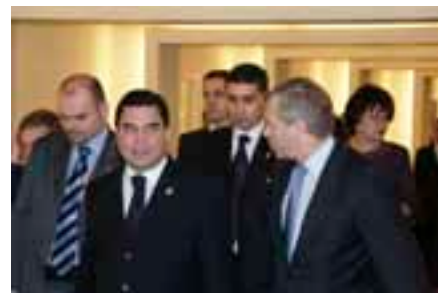
2007-nji ýylyň 7-nji noýabr aýynda Türkmenistanyň Prezidenti Gurbanguly Berdimuhamedow we NATO-nyň öňki Baş sekretary Ýaap de Hoop Sheffer iki taraply hyzmatdaşlyk bilen bagly meseleleri ara alyp maslahatlaşmak üçin NATO-nyň ştab-kwartirasynda duşuşýarlar.

ÝeAHG-niň agzalary tertipli ýagdaýda howpsuzlyk bilen bagly meseleleriň uly göwrümi boýunça, şol sanda bilelikdäki tagallalar arkaly NATO-nyň agza döwletlerinden we hyzmatdaş döwletlerinden bolan ýaraşdyryjy güýçleriň ýerleşdirilen Kosowoda we Owganystanda howpsuzlygyň şertleriniň üýtgemegi barada pikir alyşýarlar. Ondan başga ÝeAHG iş ýüzündäki hyzmatdaşlyga kömek we ony sazlaşdyrma boýunça, şeýle hem terrorizm bilen göreşmek, serhet howpsuzlygy, neşe serişdeleriniň bikanun aýlanyşygy we başga-da köpçülikleýin gyryan ýaragyň, atyjy ýaragyň we yeňil harby enjamyň ýaýradylmagy bilen bagly meseleler boýunça başlangyç pikirleri öüe sürdi.