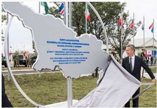
ნატო-ს გენერალური მდივანი იანს სტოლტენბერგი კრწანისში წვრთნებისა და შეფასების ერთობლივ ცენტრს ხსნის. . . თბილისი, 2015 წლის 27 აგვისტო