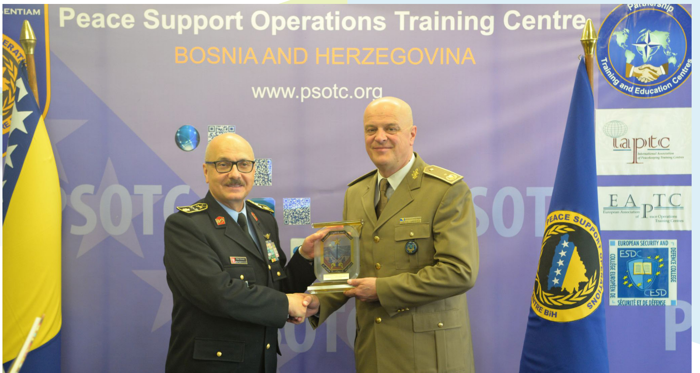
ბრიგადის გენერალი, ტუნისის შეიარაღებული ძალების გენერალური ინსპექტორი, აბდელმონამ ბელაათი და ბრიგადის გენერალი, ბოსნია და ჰერცეგოვინას შეიარაღებული ძალების გენერალური ინსპექტორი მირსად აჰმინი.