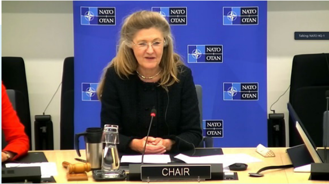
დოქტორი გერლინდე ნიჰუსი, ნატოს ოპერაციების დანაყოფის თავდაცვის ინსტიტუციებისა და შესაძლებლობების გაძლიერების დირექტორატის დირექტორის მოვალეობის შემსრულებელი

ნატოს კეთილსინდისიერების ამაღლების ცენტრმა, თავისი ნატოს კეთილსინდისიერების ამაღლების დისციპლინის მოთხოვნის დამდგენის უფლებამოსილებების ფარგლებში, მონაწილეობა მიიღო ნატოს გაერთიანებული სამეთაურო ტრანსფორმაციის მიერ ორგანიზებულ პირველ ყოველწლიურ დისციპლინათა ფორუმში. ამ ღონისძიებაზე, რომელიც გაიმართა 2022 წლის 25-28 აპრილის პერიოდში, საფრანგეთის საჰაერო ძალების ლიონის ბაზაზე, საჰაერო ოპერაციების მონაწილე ცენტრში, ნატოს სამეთაურო ტრანსფორმაციის გლობალური პროგრამირების 28 საგანმანათლებლო დისციპლინას, მოთხოვნების დამდგენ ორგანოებსა და დეპარტამენტების უფროსებს შესაძლებლობა მიეცათ გაემართათ დისკუსია დისციპლინათა მართვის სტრუქტურებთან დაკავშირებულ სხვადასხვა ასპექტზე. ეს ღონისძიება მიზნად ისახავდა კოლეგების მიერ ერთმანეთისთვის გამოცდილების გაზიარების ხელშეწყობასა და დისციპლინებს შორის სასწავლო საგნების დანერგვის სტიმულირებას.