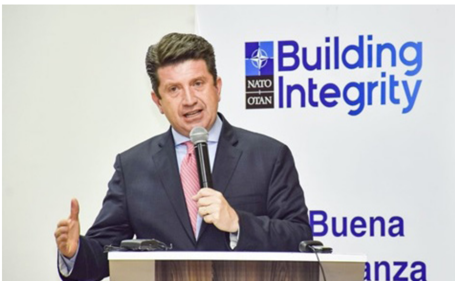
თავდაცვის მინისტრი მოლანო ნატოს კეთილსინდისიერების ამალღების ექსპერტ-შემფასებელთა ჯგუფის ვიზიტის ოფიციალური დაწყების ცერემონიაზე, 3 მაისი, 2022

ნი სანდრა ალზატე ციფუენტესი, სამშაბათს, 4 მაისს თავდაცვის მინისტრთან, დიეგო ანდროს მოლანოსთან გაიმართა ღონისძიების ოფიციალური დაწყების ცერემონია. ღონისძიებას ესწრებოდნენ სამინისტროს სამხედრო და სამოქალაქო ხელმძღვანელობის წარმომადგენლები, სახელდობრ თავდაცვის მინისტრის მოადგილე ალზატე, ვეტერანთა, სოციალურ და სამეწარმეო საკითხთა მინისტრის მოადგილე გუსტავო ნინო ფურნიელესი, სტრატეგიული განვითარების მინისტრის მოადგილე ხაირო გარსია გერერო, ისევე როგორც გენერალი ლუის ფერნანდო ნავარო ხიმენესი, სამხედრო ძალების გენერალური სარდალი, გენერალი ედუარდო ენრიკე ზაპატიერო ალტამირანდა ეროვნული ჯარის სარდალი, გაბრიელ ალფონსო პერეზ გარსესი, გენერალი რამბეს რუედა რუედა, ეროვნული საჰაერო ძალების სარდალი, გენერალი ხორგე ლუის ვარგას ვალენსია, ეროვნული საზღვაო ძალების სარდალი, და ეროვნული პოლიციის