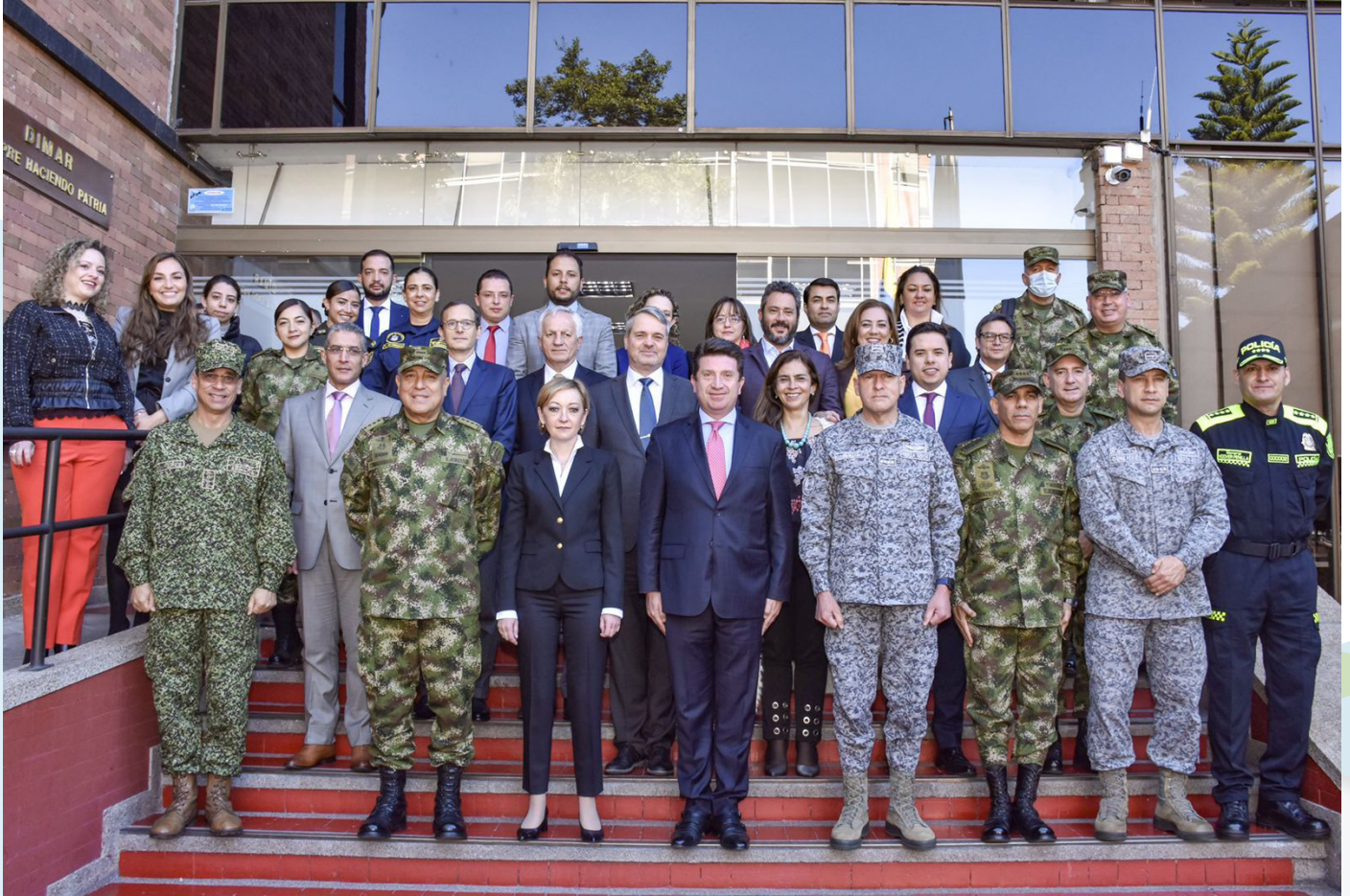
ნატოს კეთილსინდისიერების ამალღების ექსპერტ-შემფასებელთა ჯგუფის თავდაცვის მინისტრ მოლანოს ორგანიზებით კოლუმბიაში ვიზიტის ოფიციალური დაწყების ცერემონიის ამსახველი ჯგუფური ფოტო

2022 წლის 2-6 მაისის პერიოდში, ნატოს კეთილსინდისიერების ამალღების ცენტრმა კოლუმბიაში ვიზიტისას განახორციელა 2020 წლის ბოლოს ნატოში წარდგენილი თვითშეფასების შევსებული კითხვარის ექსპერტული შეფასება. აღნიშნული ვიზიტი ორგანიზებული