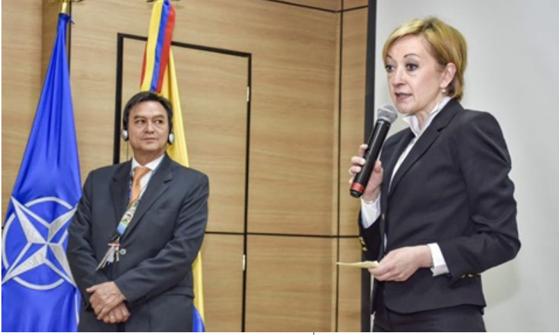
ლოქტორი ორლანდო ვეგა ნავასი, კოლუმბიის ეროვნული თავდაცვის სამინისტროს შიდა კონტროლის დეპარტამენტის უფროსი და ქალბატონი ბენედიქტე ბორელი, ნატოს კეთილსინდისიერების ამაღლების გუნდის ლიდერი და ქვეყნის თანამშრომელი კოლუმბიაში ნატოს კეთილსინდისიერების ამაღლების ექსპერტ-შემფასებელთა ჯგუფის ვიზიტის ოფიციალური დაწყების ცერემონიაზე, 3 მაისი, 2022