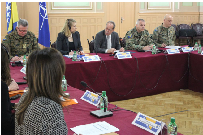
ბოსნია და ჰერცეგოვინას თავდაცვის მინისტრი, დოქტორი სიფეთ პოდინი, ისევე როგორც ბრიგადის გენერალი, ბოსნია და ჰერცეგოვინას შეიარაღებული ძალების გენერალურ ინსპექტორი მირსად აჰმიანი და დოქტორი ნადია მილანოვა, ერაყში ნატოს კეთილსინდისიერების ამალების ქვეყნის თანამშრომელი, ნატოს კეთილსინდისიერების ამალება-მსუბუქი იარაღისა და მცირე შეიარაღების პროექტის დაწყების ღონისძიებაზე, 2022 წლის 12 აპრილს, სარაევოში

იარაღების მართვის მრჩეველთა გუნდის, ჰუმანიტარული განაღმვის ჟენევის საერთაშორისო ცენტრისა და გაეროს დაცვის ექსპერტიზის თანხლებით.