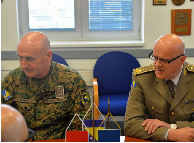
ბრიგადის გენერალი, ბოსნია და ჰერცეგოვინას შეიარაღებული ძალების გენერალური ინსპექტორი მირსად აჰმინი (მარჯვნივ) და ბოსნია და ჰერცეგოვინას შეიარაღებული ძალების მშვიდობის მხარდაჭერის ოპერაციების სასწავლო ცენტრის მეთაური, პოლკოვნიკი ელვედინ ომიჩი (მარცხნივ).

ამ გაბაფხულის მანძილზე, ნატოს კეთილსინდისიერების ამალების ცენტრსა და ტუნისის ეროვნული თავდაცვის სამინისტროს შორის გრძელდებოდა აქტიური თანამშრომლობა, მათ შორის განათლების სპეციფიურ სფეროში.