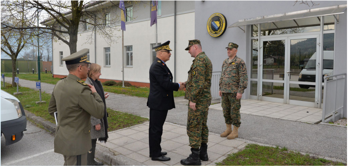
ბრიგადის გენერლის, ტუნისის შეიარაღებული ძალების გენერალური ინსპექტორის, აბდელმონამ ბელაათის ხელმძღვანელობით ტუნისელი დელეგაციის ჩამოსვლა მშვიდობის მხარდაჭერის ოპერაციების სასწავლო ცენტრში, სარაევო, ბოსნია და ჰერცეგოვინა.

ვიზიტით ობერრამერგაუს ნატოს სკოლაში. ეს საგანმანათლებლო გამოცდილების გაზიარების ტურები წარმოადგენს საგანგებოდ შემუშავებული ნატოს კეთილსინდისიერების ამაღლება - ტუნისი 2022 სამუშაო პროგრამის ნაწილს, რომლის ფარგლებშიც შეთანხმებული იქნა ტუნისის გადანაცვეტილება ტუნისის კეთილსინდისიერების ამაღლების რეგიონული ცენტრის დაფუძნების თაობაზე, და ხელს უწყობს კეთილ-