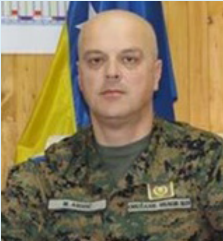
ბრიგადის გენერალი მირსად აჰმინი, ბოსნია და ჰერცეგოვინას შეიარაღებული ძალების გენერალური ინსპექტორი

ბრიგადის გენერალ აჰმინ, უკვე ათწლეულზე მეტია, რაც ბოსნია და ჰერცეგოვინა აქტიურად მონაწილეობს ნატოს კეთილსინდისიერების ამალღების პროცესში. თქვენ, ბოსნია და ჰერცეგოვინას თავდაცვის სამინისტროს მიერ მიმართული ამ ძალისხმევის წინა ხაზზე ხართ. თქვენი აზრით, რა გავლენა აქვს ამ პროცესებს სამინისტროს გადმოსახედიდან?