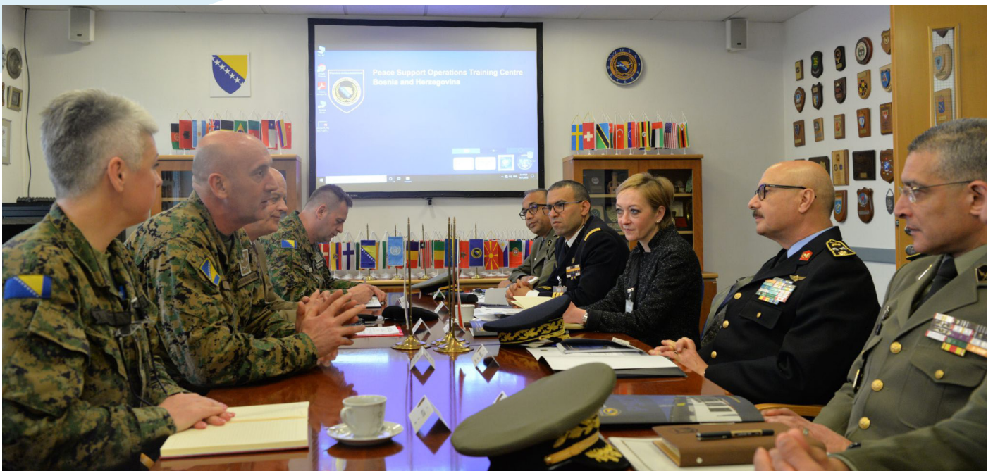
გამოცდილების ურთიერთგაცვლა და დისკუსიები მშვიდობის მხარდაჭერის ოპერაციების სასწავლო ცენტრში, სარაევო, ბოსნია და ჰერცეგოვინა.

შესაძლებლობების განვითარების პაკეტის განხორციელების მხარდაჭერის შეფასება. ეს შეფასება განხორციელდა დისტანციურად, ონლაინ რეჟიმში, რა დროსაც შესაძლებელი იქნა განხილულიყო ტუნისის თავდაცვის სექტორში კარგი მმართველობისა და კეთილსინდისიერების ამაღლებასთან დაკავშირებულ სხვა სფეროებში თანამშრომლობის საკითხები.