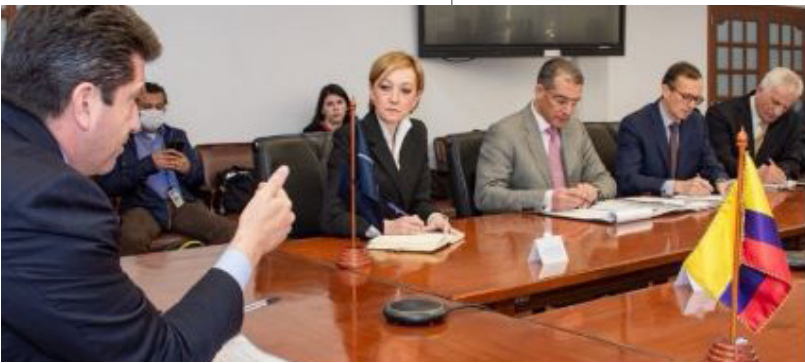
ორმხრივი შეხვედრა თავდაცვის მინისტრ მოლანოსა და ნატოს კეთილსინდისიერების ამაღლების ექსპერტ-შემფასებელთა ჯგუფს შორის, რომელსაც ესწრებოდნენ ქალბატონი ბენედიქტე ბორელი, ნატოს კეთილსინდისიერების ამაღლების გუნდის ლიდერი და ქვეყნის თანამშრომელი კოლუმბიაში, მუჰამედ-ალი ამრი, ტუნისის შეიარაღებული ძალების უფროსი პოლკოვნიკი, ბატონი ფრანსუა გონი, ნატოს შიდა აუდიტისა და რისკების მართვის ოფისის ხელმძღვანელი, ყოფილი ელჩი ვალერი რატჩევი, ექსპერტი ნატოს კეთილსინდისიერების ამაღლების საკითხებში, და ბატონი კირე კნუცენი, ნორვეგიის თავდაცვის სამინისტროს უფროსი ოფიცერი.