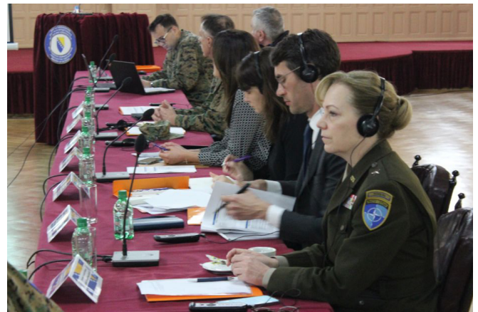
ნატოს სარაევოს შტაბ-ბინის მეთაური, ბრიგადის გენერალი პამელა მაკაკაპა, ისევე როგორც შეიარაღების მართვის მრჩეველთა გუნდის ექსპერტები ბატონი ბენჯამინ კინგი და ქალბატონი სავანა დე ტესერი ნატოს კეთილსინდისიერების ამალება-მსუბუქი იარაღისა და მცირე შეიარაღების პროექტის დაწყების ღონისძიებაზე, 2022 წლის 12 აპრილს, სარაევოში

მსუბუქი იარაღისა და მცირე შეიარაღების ვარგისიანობის ციკლის მართვის სფეროში კეთილსინდისიერების, გამჭვირვალობისა და ანგარიშვალდებულების გაძლიერებას კრიტიკული მნიშვნელობა აქვს. პროექტი მიზ-