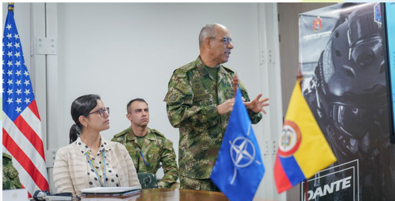
ეროვნული ჯარის სარდალი, გენერალი ედუარდო ენრიკე ზაპატეირა ალტამირანდა

გენერალური დირექტორი (ფოტოები 1+2), სხვადასხვა აღმასრულებლები და დეპარტამენტების უფროსები. ნატოს კეთილსინდისიერების ამაღლების ექსპერტ-შემფასებელთა ჯგუფმა, რომელიც შედგებოდა ნატოსა და ნატოს კეთილსინდისიერების ამაღლების საკითხზე მომუშავე ექსპერტებისაგან, და ნორვეგიისა და ტუნისის წარმომადგენელი ექსპერტებისაგან, ორმხრივი შეხვედრა გამართა თავდაცვის მინისტრ მოლანოსთან (ფოტო 3) და მინისტრის სამ მოადგილესთან, რა დროსაც მათ მიმოიხილეს აღნიშნული ვიზიტი, ისევე როგორც ნატოს კეთილსინდისიერების ამაღლების სფეროში თანამშრომლობის საგანი. ამ კვირის განმავლობაში ნატოს კეთილსინდისიერების ამაღლების ექსპერტ-შემფასებელთა ჯგუფს შესაძლებლობა მიეცა გულდასმით შეესწავლა კეთილსინდისიერების ამაღლების პირველი პროცესის დასრულების შემდგომ (2014-2016 წლები) ჩატარებული რეფორმების შინაარსი, მათი შედეგად და მიმოიხილა ადამიანური და ფინანსური რესურსებისა და აღჭურვილობის არსებული მართვის სისტემა (ფოტო 4).