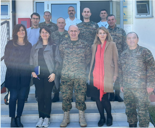
ნატოს კეთილსინდისიერების ამალება-მსუბუქი იარაღისა და მცირე შეიარაღების პროექტის გუნდის ვიზიტი ბოსნია და ჰერცეგოვინას შეიარაღებული ძალების ლოგისტიკის სარდლობაში, დობოჯი, 2022 წლის 13 აპრილი

2022 წლის თებერვალში, ნატოს კეთილსინდისიერების ამალების ცენტრმა დაიწყო პროექტის „მსუბუქი იარაღის, მცირე შეიარაღებისა და საბრძოლო მასალის ვარგისიანობის ციკლის მართვის სფეროში კარგი მმართველობის, ანგარიშვალდებულებისა და კორუფციის პრევენციის ინსტიტუციური შესაძლებლობების განვითარება: ბოსნია და ჰერცეგოვინას მაგალითზე მიღებული გამოცდილება და კარგი პრაქტიკა“ იმპლემენტაცია. პროექტი ხორციელდება ბოსნია და ჰერცეგოვინას თავდაცვის სამინისტროსთან თანამშრომლობით, 1 შე-