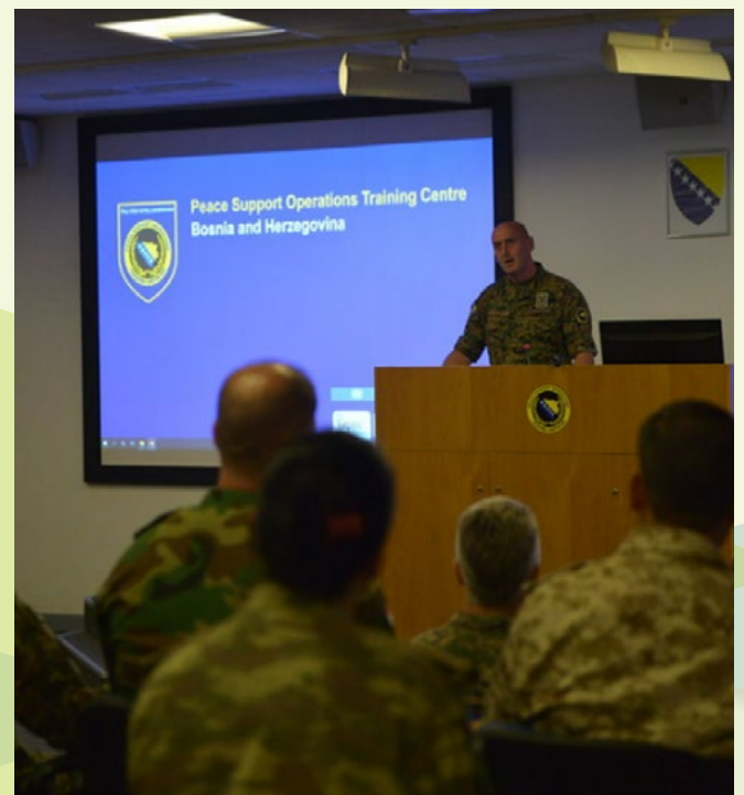
Un instructeur donne une conférence aux participants pendant le stage sur le développement de l'intégrité dans les opérations de soutien de la paix.

Le stage a pour but de renforcer les capacités d'identification des risques de corruption. Il enseigne des mesures d'atténuation et des démarches de développement de l'intégrité dans le contexte des missions et des opérations. Socle de connaissances, le stage apporte des informations générales sur les obstacles identifiés et les enseignements tirés. Le processus d'apprentissage est renforcé par les échanges d'expériences entre participants venant de différents pays et régions. Ces personnes participent également à des études de cas fondés sur des scénarios et à des jeux de rôles, sous la conduite des formateurs et des instructeurs du PSOTC.