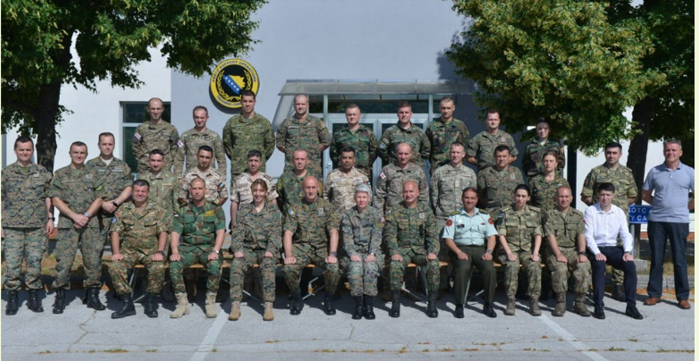
Photo de groupe des officiers participants, PSOTC (Sarajevo), 1 er juillet 2022.

Après avoir dispensé ses formations en ligne ces deux dernières années, le Centre de formation aux opérations de soutien de la paix (PSOTC), à Sarajevo (Bosnie-Herzégovine), a repris ses stages en présentiel cet été. Du 27 juin au 1 er juillet, le PSOTC a organisé son stage certifié par l'OTAN sur le développement de l'intégrité dans les opérations de soutien de la paix, destiné aux officiers et aux civils des structures de l'OTAN, des pays de l'OTAN et des pays partenaires, en particulier l'Arménie, la Bosnie-Herzégovine, la Géorgie, la Jordanie, la République de Moldova et la Tunisie.