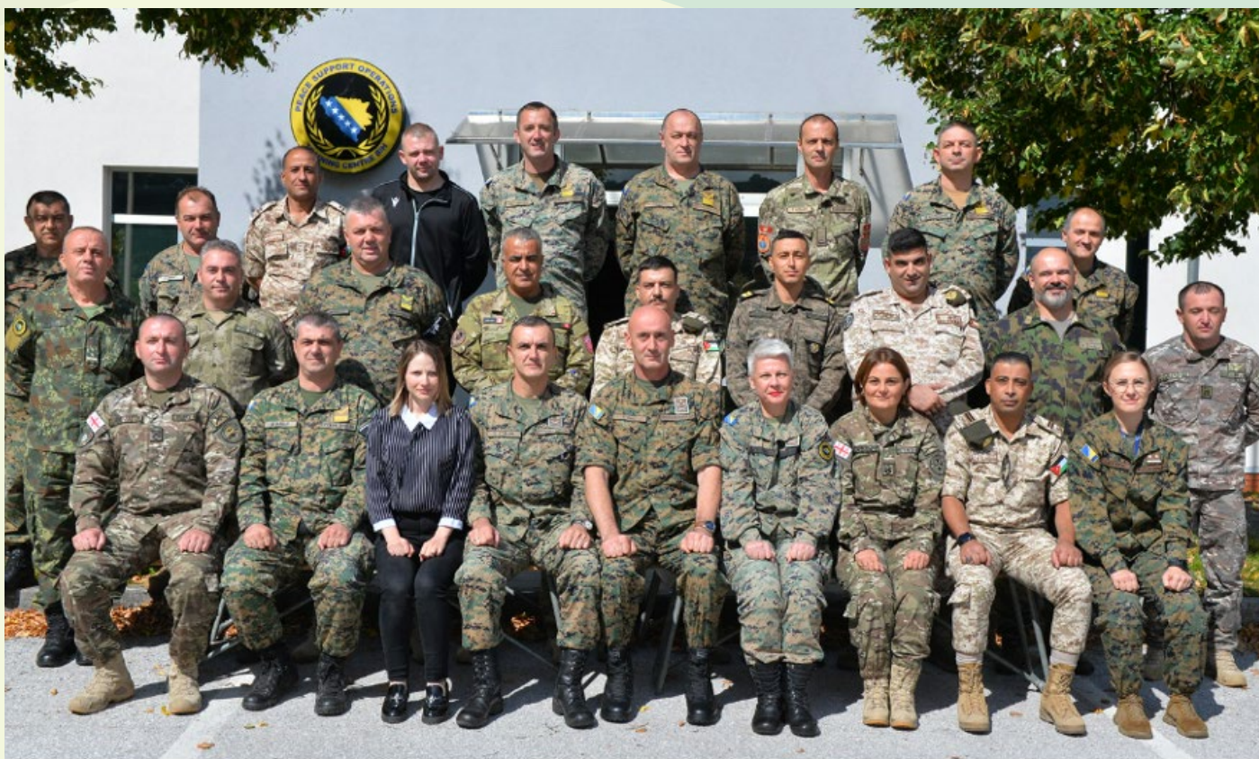
Arrêts sur image des participants lors du stage sur le développement de l'intégrité destiné aux sous-officiers supérieurs au PSOTC, à Sarajevo.