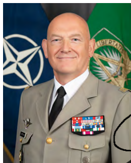
Olivier Rittimann General Locotenent, FRA Șef de Stat Major Adjunct SHAPE

Prin urmare, sunt încântat să vă prezint primul manual ACO de Consolidare a Integrității. Deși a fost elaborat pentru nivelul operațional NATO, manualul se aplică atât nivelelor tactice cât și strategice. Aș încuraja ca fiecare membru al personalului NATO ACO să parcurgă acest manual și să-și însușească lecțiile și valorile cuprinse aici. În final, aș dori să mulțumesc tuturor celor din cadrul NATO care au contribuit la această lucrare, precum și entităților non-NATO, a căror colaborare și ale căror eforturi sunt extrem de apreciate.