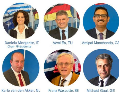
Les membres du Collège

L'IBAN a pour mission de fournir, en toute indépendance, au Conseil de l'Atlantique Nord et aux gouvernements des pays membres de l'OTAN l'assurance que les fonds mis à disposition ont été utilisés pour le règlement de dépenses autorisées, et que les états financiers des entités OTAN donnent une image fidèle et exacte de leur situation financière. L'IBAN s'attache également à déterminer si l'OTAN mène ses activités dans le respect des critères d'efficience, d'efficacité et d'économie.