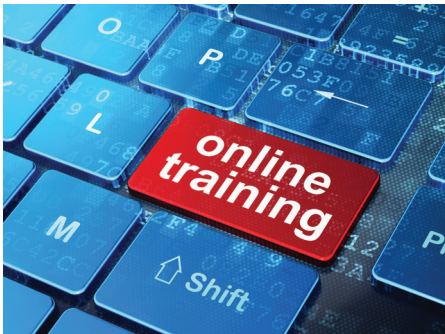
Curso de la OTAN de Sensibilización sobre Generar Integridad.

Los efectos de la corrupción sobre una misión deben tratarse mediante un programa integral de capacitación y educación sobre Generar Integridad. Esto