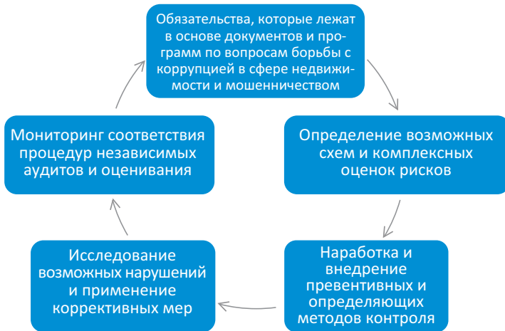
Рис. 1. Модель процесса