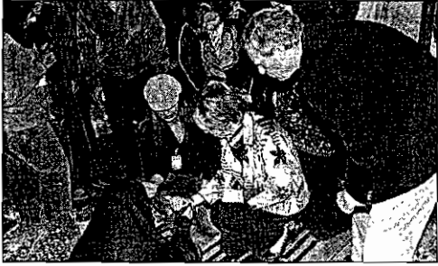
روحة الأمين العام لحلف الناتو تخضب كثرها بالحناء