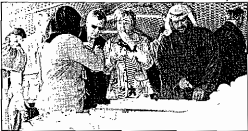
الفهد وضيفه يتفوقون الطويات الشبية