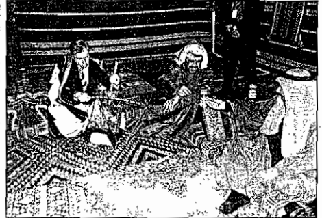
الفهد يعلم الأمين العام لحلف الناتو عزف الربابة

وكان في وداع شيفر رئيس جهاز الامن الوطني الشيخ احمد الفهد ونائبه الشيخ ثامر العلي ومدير ادارة مكتب نائب رئيس مجلس الوزراء وزير الخارجية الشيخ الدكتور احمد ناصر المحمد. وعلى هامش مأدبة الغداء التي اقامتها مؤسسة البترول الوطنية في مضيحتها بالجنيعة اسس على