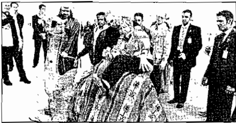
شيفر يساعده زوجته على ركوب قبعير

والانفاقات وغيرها من الفعاليات تكلت جميعها بالنجاح. وأشار الفهد الى ان «هناك لقاءات متبادلة بين الجانبين (الكويت والناتو) ستتم في المستقبل القريب». لافتاً الى ان هناك زيارة كاملة لرئيس الأركان الكويتي (اللواء ركن طيار فهد الأمير) للالتقاء بتظيره العسكري في حلف الناتو. وأكد الفهد ان «العمل مع مثل هذه المنظمات (الناتو) سيفري الجانبين الاسني والمعلوماتي للكويت وسيكون احد الحواجز الأمنية المنيعه التي يمكن ان تحمي الكويت».