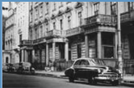
Prvi sedež zveze NATO v Londonu.

Ustanovne članice NATO - Belgija, Danska, Francija, Islandija, Italija, Kanada, Luksemburg, Nizozemska, Norveška, Portugalska, Združene države Amerike in Združeno kraljestvo - so se obvezale, da bodo druga drugo branile v primeru vojaške agresije proti kateri