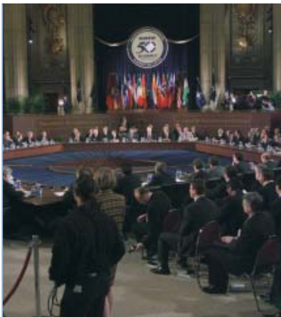
Pogajanja med bivšimi nasprotniki so se pričela po končani hladni vojni. Danes države članice zveze NATO in partnerice redno razpravljajo o skupnih varnostnih vprašanjih.

Poleg tega je NATO dal vrsto drugih pobud kot odgovor prihodnjim varnostnim izzivom. Med najpomembnejšimi so: Pobuda za obrambne zmogljivosti (Defence Capabilities Initiative - DCI); razvoj Evropske varnostne in obrambne identitete v okviru zaveznitva (European Security and Defence Identity - ESDI) ter ustanovitev Centra za orožje za množično uničenje, ki naj bi skušal izboljšati sposobnost zaveznitva za odgovor na grožnje, ki jih predstavlja takšno orožje ter preprečiti njegovo širjenje.