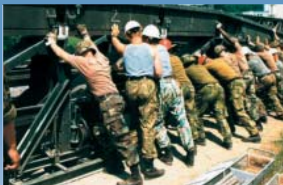
Večnacionalne sile pri obnovi mostu v Bosni.

Evroatlantski partnerski svet (EAPS), je postal poglobitni forum za posvetovanje in sodelovanje med zvezo NATO in državami nečlanicami. Pristna solidarnost med vsemi državami članicami Evroatlantskega partnerskega sveta se je potrdila tudi s tem, da so zavzele skupno držo proti terorizmu. Z obsodbo terorističnih napadov na Združene države, 11. septembra 2001, so se članice EAPS zaobljubile, da bodo storile vse za to, da izkoreninijo terorizem in potrdile svoje prepričanje, da bodo zmagali ideali partnerstva in sodelovanja.