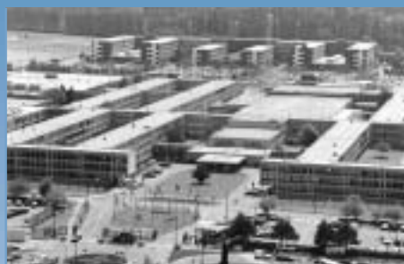
Sedanji sedež zveze NATO v Bruslju.

koli od njih. Zdelo se je, da so v zgodnjih petdesetih letih mednarodni dogodki, ki so dosegli vrhunec z izbruhom korejske vojne, potrdili strahove Zahoda pred neposrednimi ali posrednimi ekspanzionističnimi težnjami Sovjetske zveze. Skladno s tem so države članice zveze NATO okrepile svoja prizadevanja za razvoj vojaških struktur, potrebnih za uresničitev svoje zaveze h kolektivni obrambi. Vendar je zveza NATO ostala politično vodena organizacija, ki je skrbela za interese vseh svojih članic, v nasprotju z Varšavskim paktom, ki je bil ustanovljen leta 1955, in je bil predvsem orodje sovjetske politične in vojaške prevlade nad Vzhodno Evropo.