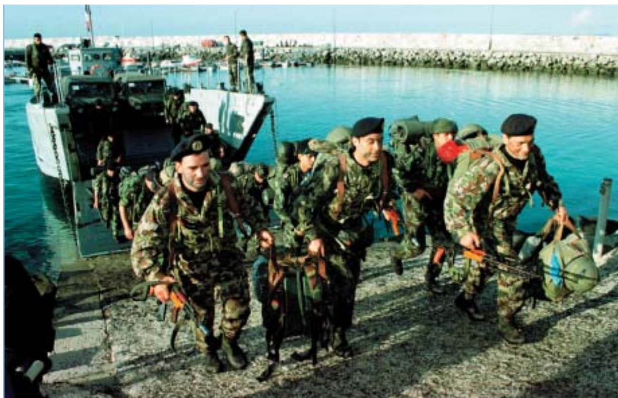
▶ Skupno premaganje novih varnostnih izzivov: vaja amfibijskega izkrcaja portugalskih, francoskih in romunskih vojakov.

slednje ne dodelijo nalog od kolektivne obrambe do novih nalog, kot sta ohranjanje miru in podpora miru. Vloga političnih in vojaških struktur zveze NATO je, da zagotavljajo politično vodenje in skupno vojaško načrtovanje, potrebno za to, da bi vojaške sile posameznih držav lahko opravile omenjene naloge ter organizacijske ukrepe, potrebne za skupno poveljevanje, nadzor, usposabljanje in vaje.