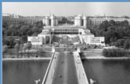
V petdesetih in šestdesetih letih je bil sedež zveze NATO v Parizu.