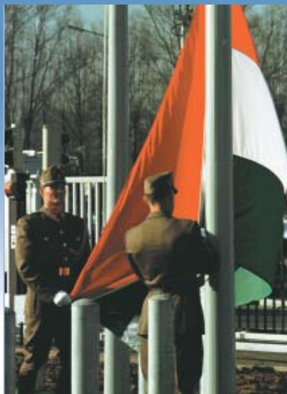
Leta 1999 so tri srednjeevropske demokratične države pristopile k zvezi NATO.

Na sestanku na vrhu v Washingtonu aprila 1999 so voditelji zveze NATO poudarili dejstvo, da tri nove države članice ne bodo zadnje. Odločitve o naslednjih povabilih v članstvo bodo sprejete predvidoma na naslednjem sestanku Severnoatlantskega sveta na vrhu leta 2002.