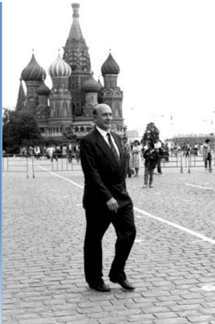
Po končani hladni vojni некоč neverjetno postaja resnično. Takratni generalni sekretar zveze NATO, Manfred Woerner, leta 1990 obiše Moskvo na začetku novih odnosov med Vzhodom in Zahodom.

Kljub razpadu Sovjetske zveze so se upi za mir vendarle izkazali za preuranjene. Kmalu je postalo očitno, da se je nestabilnost v nekaterih delih Evrope še povečala, čeprav morda s koncem hladne vojne ni bilo več neposredne vojaške nevarnosti. V nekdanji Jugoslaviji in v nekaterih delih nekdanje Sovjetske zveze so izbruhnili številni regionalni konflikti, ki so jih pogosto podžigale etnične in verske napetosti, in ki so grozili, da se bodo razširili na širše območje. Države članice zveze NATO so kmalu spoznale, da je njihova zavezanost skupni obrambi in sodelovanju, ki so ju vzpostavile prek zavezništva, še vedno najboljše zagotovilo za varnost.