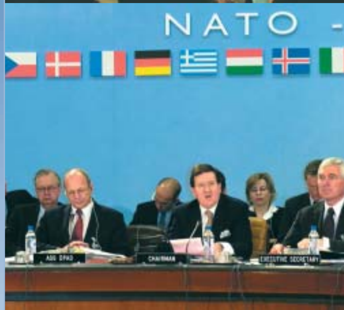
Generalni sekretar zveze NATO, lord Robertson, med predsedovanjem seji Severnoatlantskega sveta.

Na čelu zveze NATO je generalni sekretar, ki je imenovan za približno štiri leta. Generalni sekretar je višji mednarodni državnik iz ene od držav članic.