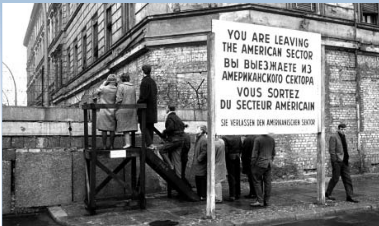
▶ Skoraj trideset let je bil Berlinski zid simbol razdeljene Evrope.

Prek zveze NATO sta Zahodna Evropa in Severna Amerika skupaj branili svojo neodvisnost, hkrati pa dosegli do tedaj najvišjo stopnjo stabilnosti. Dejansko je bila varnost, ki jo je zagotavljal NATO, opisana kot "kisik za blaginjo", ki je postavila temelje evropskemu gospodarskemu sodelovanju in povezovanju. Prav tako je utrla pot k zaključku hladne vojne in delitvi Evrope na začetku devetdesetih let.