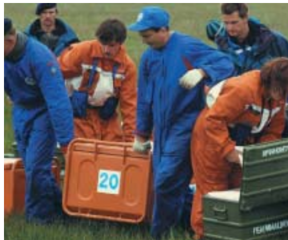
Ruska mobilna bolnišnica na vajah na Islandiji.