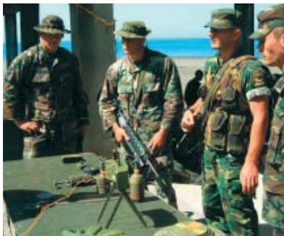
Francoski specialist za mine uči gruzijsko in ameriško mornariško pehoto.

Na teh sestankih se je razpravljalo o ohranjanju miru na Balkanu, kriznem vodenju in neširjenju orožja za množično uničenje ter o preoblikovanju vojaške industrije, varstvu okolja in civilnem kriznem načrtovanju. Obe državi sta skupaj s preostalimi državami partnericami sodelovali v prizadevanjih zveze NATO za mir v Bosni in Hercegovini. Zaradi ostrih razhajanj glede odločitve zveze NATO za vojaško posredovanje, da bi preprečila humanitarno katastrofo na Kosovu, je Ruska federacija leta 1999 začasno prenehala sodelovati v Stalnem skupnem svetu zveze NATO in Rusije. Po koncu krize pa je Rusija privolila v to, da prispeva svoje sile k enotam KFOR-ja. Ukrajinske sile so se prav tako pridružile silam KFOR-ja. Sodelovanje in posvetovanja med zvezo NATO in Rusijo so se v okviru Stalnega skupnega sveta nadaljevala leta 2000.