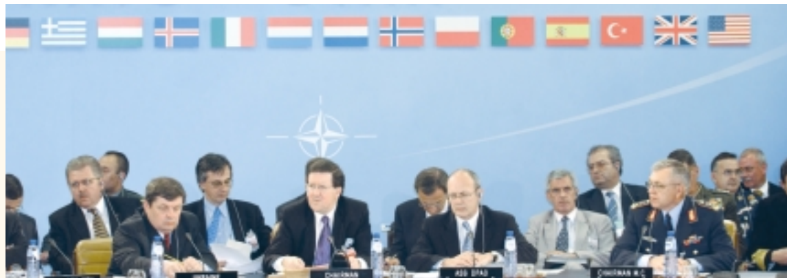
Міністри оборони країн – членів НАТО та України обговорюють досягнення у галузі оборонної реформи та реформи сектора безпеки. Брюссель, 12 червня 2003 року

шляхом визначення пріоритетів, послідовності та обсягів фінансування, яке має бути спрямоване на підтримку основних галузей співпраці з євроатлантичними структурами. Центр також бере участь у вдосконаленні чинного законодавства України з метою приведення його у відповідність до проголошеної мети євроатлантичної інтеграції.