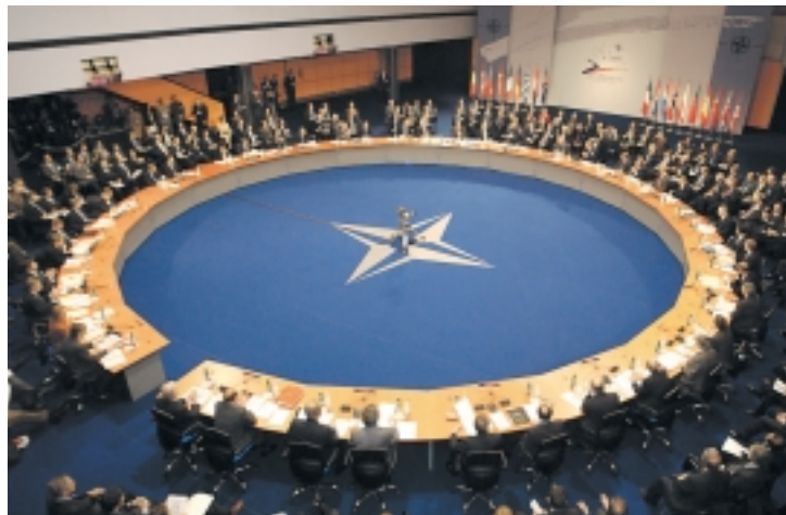
«Зоряна палата» штаб-квартири НАТО: після приєднання до Альянсу семи нових країн члени Північноатлантичної ради будуть висловлювати більше різних поглядів за столом засідань.

По-друге, ми маємо завершити оформлення наших відносин з Європейським союзом. Ми відразу почали працювати над впровадженням грудневої