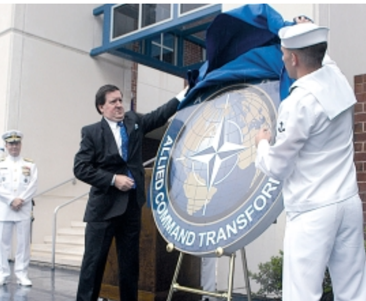
Офіційне відкриття емблеми новоутвореного Об'єднаного командування НАТО з питань трансформації

оборонної реформи в Україні, охоплюючи широке коло питань, серед яких – політика в оборонній галузі, встановлення демократичного контролю над збройними силами, державна політика стосовно співпраці у рамках ПЗМ, а також управління ресурсами в оборонному секторі. З метою полегшення розповсюдження технічної та військової документації серед українських військових підрозділів, які визначені для участі в операціях ПЗМ, а також надання такої інформації українським урядовим установам, залученим до співробітництва між Україною та НАТО, у грудні 2002 року група фахівців Командування ОЗС НАТО на Атлантиці відвідала Київ для вивчення можливості відкриття в Україні Центру документації ПЗМ, для чого був розроблений відповідний проект. Очікується, що на початку осені 2003 року буде підписана відповідна технічна угода.