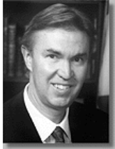
Канада: Посол Девід Райт