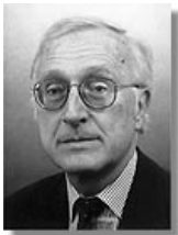
Нідерланди: Посол Хендрік Бігман