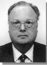
Бельгія: Посол Тьєрі де Грубен