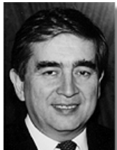
Туреччина: Посол Онур Оймен