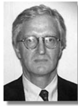
Норвегія: Посол Яккен Бйорн Ліан