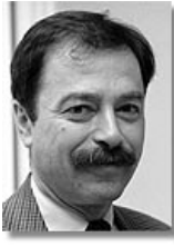
Угорщина: Посол Андраш Шімоні