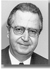
Греція: Посол Георг Савваїдес