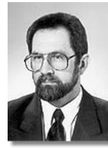
Польща: Посол Анджей Товфік