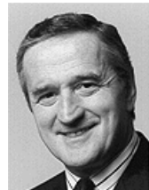
Велика Британія: Посол Сер Джон Гулден