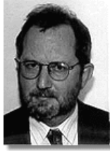
Чеська Республіка: Посол Карел Кованда