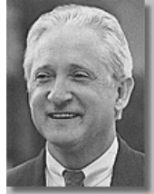
Франція: Посол Філіпп Гюї