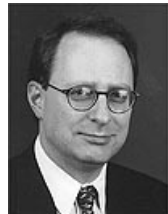
США: Посол Александр Р. Вершба