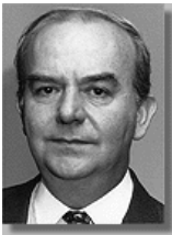
Іспанія: Посол Хав'єр Конде де Саро