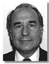
Португалія: Посол Фернандо Андресен - Гуймараєс