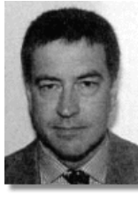
Ісландія: Посол Гуннар Палссон