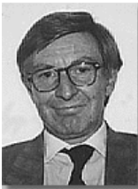
Люксембург: Посол Жан-Жак Касель