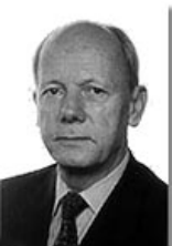
Німеччина: Посол Герхардт Вон Молтке