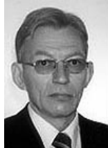
Данія: Посол Нільс Егелунд