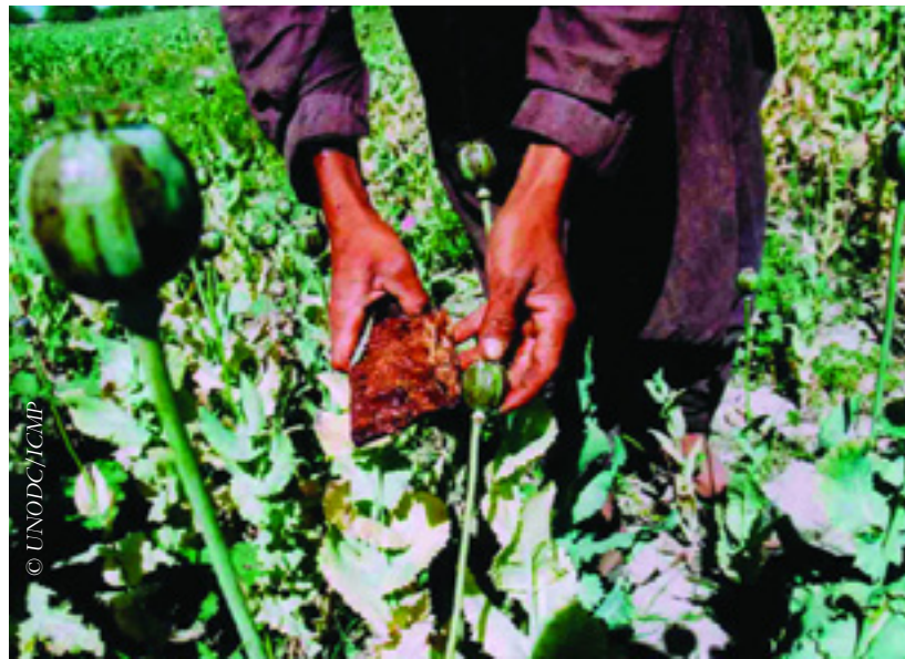
Опасный урожай: Совет Россия-НАТО договорился начать совместный экспериментальный проект по обучению кадров для Афганистана и Центральной Азии методам антинаркотической борьбы

Учитывая особые нужды слушателей из данного региона и на основе консультаций с соответствующими национальными органами государств, для которых предназначена программа, предполагается использовать в учебном процессе элементы из курсов, разработанных различными ведомствами государств-членов СРН, в том числе Турецкой международной академией по борьбе с наркотиками и организованной преступностью (ТАДОК), российским Центром обучения антинаркотической борьбе (Домодедово), а также из курсов подготовки, проводимых в регионе на двусторонней основе государствами-членами СРН.