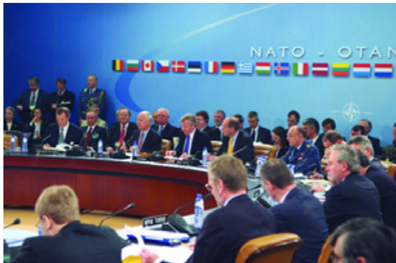
Министры стран НАТО обсуждают политические аспекты операций и миссий под руководством НАТО на встрече 8 декабря

На состоявшейся затем встрече Североатлантического совета министры сосредоточили свое внимание, главным образом, на политических аспектах текущих операций под руководством Североатлантического союза. Они утвердили пересмотренный Оперативный план, предусматривающий расширение в 2006 году района действия Международных сил содействия безопасности в Афганистане на южные территории страны. Это потребует перебросить в Афганистан дополнительно несколько тысяч военнослужащих с более жесткими правилами применения силы, так как они будут действовать в более нестабильной обстановке. Будут также созданы четыре новые военно-гражданские провинциальные группы реконструкции, и, таким образом, в целом в стране будут находиться 15 ПГР. После того, как произойдет расширение района действий ИСАФ, операция НАТО охватит три четверти территории Афганистана. Силы под руководством НАТО будут помогать в создании условий, при которых террористы больше не смогут захватить страну и использовать ее в качестве плацдарма, с которого они бы угрожали всей планете, а также в укреплении мира, столь необходимого людям, на чью долю выпало немало страданий. В дополнение к контингенту и в ответ на просьбу президента Афганистана о поддержке всеобъемлющих долгосрочных отношений с НАТО министры