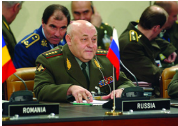
Начальник Генерального штаба Вооруженных Сил Российской Федерации генерал армии Юрий Балувевский присутствует на встрече 15 ноября с коллегами из стран НАТО

В области борьбы с терроризмом, СРН на уровне военных представителей готовит войсковое учение сил специального назначения, которое намечено провести в сентябре следующего года в России. Различные аспекты антитеррористической борьбы были включены в учения и мероприятия по боевой подготовке на 2006 г. Кроме того, содействие в подготовке кораблей Черноморского Флота России к участию в следующем году в операции « Актив эндевор » дает немало возможностей для развития сотрудничества Россия-НАТО в борьбе с терроризмом и для укрепления оперативной совместимости.