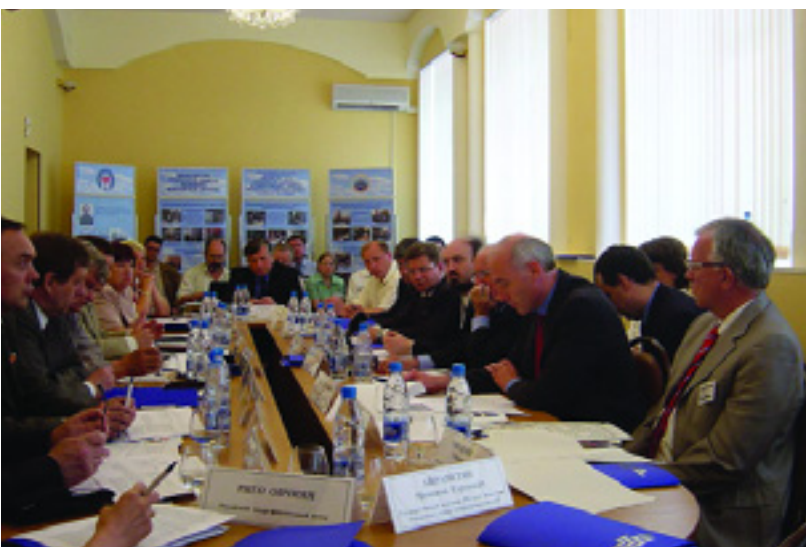
Май 2005 г., город Ногинск Московской области: идет Круглый стол по проблемам трудоустройства военнослужащих запаса и членов их семей, создания дополнительных рабочих мест через развитие малых предприятий

Учебная деятельность в Центре Россия-НАТО проходит как по программе «обучение обучающихся», так и в рамках курсов прямой профессиональной переподготовки. С тех пор, как Центр проводит учебную деятельность, курсы повышения квалификации прошли в нем 470 инструкторов (все они нашли работу в частном секторе или в государственных агентствах по трудоустройству), а курсы переподготовки прошли 850 военнослужащих (80 процентов из них смогли трудоустроиться). А с декабря 2004 г. в Центре действует отдел трудоустройства, который за первый год своей работы помог найти работу 325 чел.