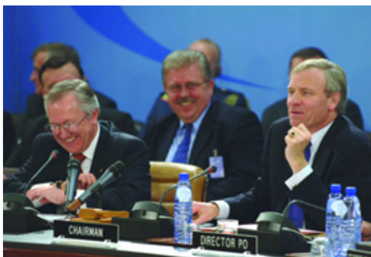
Министр иностранных дел Украины Борис Тарасюк (слева) и Генеральный секретарь НАТО Яап де Хооп Схеффер участвуют в дружеской, но откровенной дискуссии во время состоявшейся 8 декабря встречи Комиссии Украина-НАТО

Обсуждение коснулось, главным образом, успехов, достигнутых в 2005 г. в укреплении демократических институтов Украины и реформировании оборонного и силового секторов. Министры стран НАТО указали, что предстоящие в марте 2006 г. парламентские выборы являются для Украины замечательной возможностью продемонстрировать прочный характер демократических реформ. Они также приветствовали готовность правительства предпринять всеобъемлющий обзор украинского силового сектора. Министры призвали Украину продолжать судебную и административную реформу, и, в том числе, борьбу с коррупцией, а также усилия по укреплению региональной безопасности. Наконец, министры заявили, что ожидают скорейшего принятия и своевременной и целенаправленной реализации обширного ежегодного Целевого плана Украина-НАТО на 2006 г., который в настоящее время находится в процессе разработки.