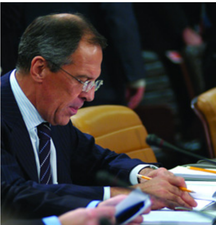
Министр иностранных дел Российской Федерации Сергей Лавров участвует в состоявшемся 8 декабря заседании Совета Россия-НАТО, на котором была утверждена обширная Программа работы на 2006 год

Наконец, с удовлетворением отметив значительный прогресс, достигнутый за последние три с половиной года в областях сотрудничества, названных главами государств и правительств на Римской встрече в верхах Россия-НАТО в 2002 г., министры признали необходимость поиска новых возможностей для углубления сотрудничества в рамках СРН. В этой связи они поручили послам СРН представить соответствующие рекомендации к следующей встрече министров иностранных дел.