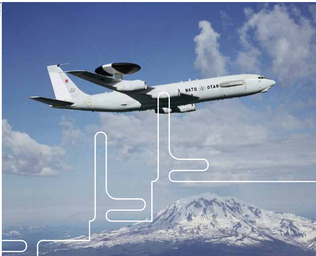
НАТО-ове летелице "авакс" обезбеђују осматрање већих догађаја и кризних ситуација