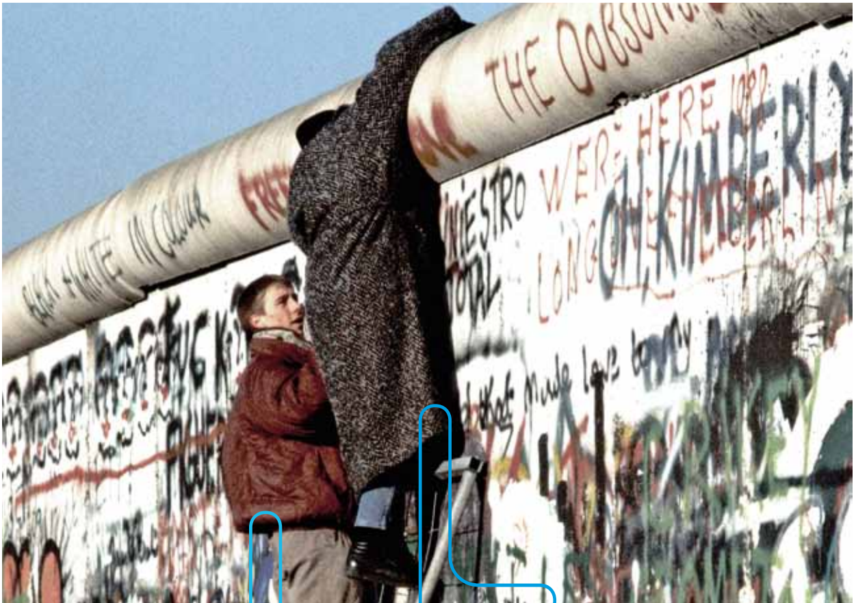
1989. Пад Берлинског зида