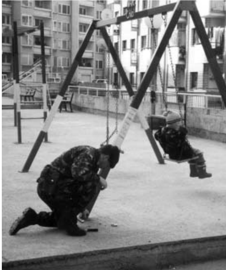
In servizio al parco giochi: alcuni dei più veri combattenti, come i Royal Marines, possono anche eccellere nel mantenimento della pace

Ma i soldati dovranno trovare un compromesso con gli organismi per gli aiuti umanitari e le altre ONG, con le organizzazioni internazionali e con le altre istituzioni governative e con le autorità locali. L'ambito della formazione di ufficiali e sottufficiali dovrà essere ampliato per consentire loro di adattarsi e di fronteggiare le peculiarità delle altre organizzazioni. Ciò viene fatto sempre più attraverso corsi dedicati al personale, che sono sempre più "interforze", con spazio regolarmente dedicato alle operazioni integrate e al lavoro delle ONG. Comunque, altre organizzazioni trovano maggiori difficoltà ad adattarsi. Pochi altri organismi governativi, senza neppure parlare delle ONG, possono consentire che il proprio personale partecipi a lunghi corsi di addestramento e di formazione come fanno i militari. La priorità per le ONG, giustamente, che vivono del denaro dei benefattori, è quella di andare sul campo e salvare o ricostruire delle vite il più rapidamente ed efficacemente possibile. Tocca quindi ai militari essere particolarmente sensibili alle preoccupazioni delle ONG e sviluppare con esse il giusto rapporto. ■