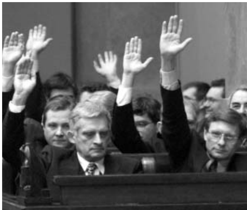
Per levata di mano: una larga maggioranza del parlamento polacco ha votato a favore dell'adesione alla NATO e del programma di riforme della difesa

È probabile che l'ammodernamento tecnico delle forze armate risulti meno traumatico, ma egualmente costoso. Il punto focale del programma di ammodernamento sarà costituito dal dotare le Unità ad alta capacità di prontezza operativa (un terzo delle forze armate) di moderni equipaggiamenti. Ciò si otterrà sia acquisendo nuovi equipaggiamenti che ammodernando i vecchi, come pure destinando armamenti attualmente utilizzati da altri tipi di forze alle Unità ad alta capacità di prontezza operativa. Il processo di ammodernamento tecnico si basa su dei