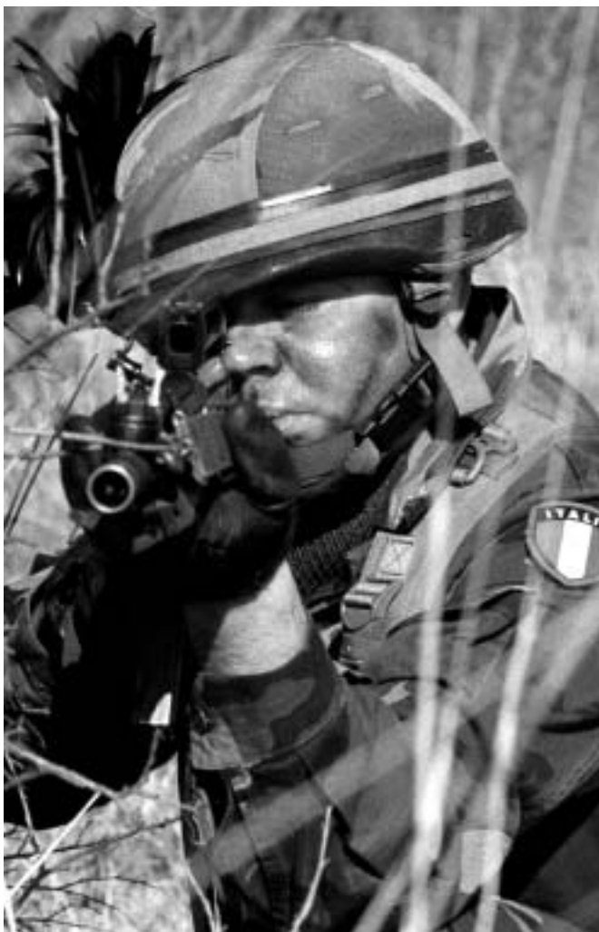
Obiettivo raggiunto: l'Italia ha accresciuto il suo contributo alle operazioni di mantenimento della pace a guida NATO nei Balcani sino a raggiungere quello di Francia e del Regno Unito

I miei documenti sulla campagna in Kosovo includono due aspetti poco noti: la questione della cosiddetta "opzione terrestre" e la situazione albanese. All'inizio del conflitto, la strategia di Milosevic appariva quella di compiere uno sforzo per resistere agli attacchi aerei finché la coalizione contro di lui non si fosse frantumata, mentre destabilizzava i paesi limitrofi come l'Albania e la Repubblica ex jugoslava di Macedonia*, il cui territorio aveva costituito una necessaria tappa per le forze terrestri della NATO. Ad un mese dall'inizio dell'operazione Allied Force , l'efficacia di una campagna basata interamente sull'utilizzo della potenza aerea venne messa in dubbio e la NATO fu spinta a proporre un'altra opzione per concludere vittoriosamente il conflitto. Sebbene dei piani per una invasione terrestre del Kosovo non fossero mai stati formulati, tale materia venne discussa in una riunione informale dei Ministri della difesa dei cinque più grandi paesi membri della NATO, che si tenne il 27 maggio. Peraltro, nonostante fosse considerata l'anello più debole della coalizione, l'Italia in quella riunione si impegnò senza porre condizioni a fornire fino a 10.000 uomini, una circostanza riportata nella recente opera del Generale Wesley Clark, ex SACEUR.