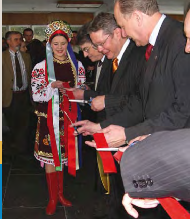
Церемонія офіційного відкриття фінансованого НАТО Центру перепідготовки та соціальної адаптації колишніх військовослужбовців у Хмельницькому, 15 лютого 2006 року. Завдяки активній підтримці з боку НАТО Центр є найбільшою установою, що надає подібну допомогу українським військовослужбовцям, які звільняються з дійсної військової служби.

Співробітництво України та НАТО у цьому питанні здійснюється за трьома основними напрямками. Перший – це програма перепідготовки, що фінансується НАТО та передбачає мовну і спеціалізовану професійну підготовку для близько 200 колишніх військовослужбовців щорічно.