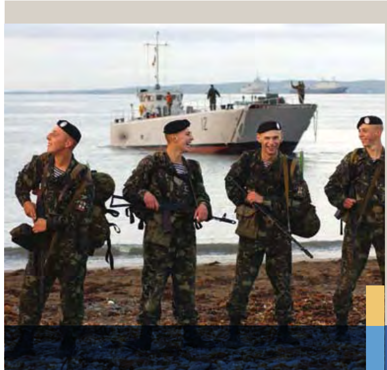
Українські військовослужбовці беруть участь у навчаннях НАТО “Північне сяйво – 2003” в Ірландському морі на західному узбережжі Шотландії та у Бретані, Франція, вересень 2003 року.

Військове співробітництво має також лідируючі позиції у розвитку юридичної бази, яка дозволяє Україні та НАТО вести подальший розвиток співробітництва на оперативному рівні. Така діяльність передбачає прийняття Угоди ПЗМ про статус збройних сил на території іншої країни, яка набула чинності у травні 2000 року і забезпечує участь у військових навчаннях у рамках програми ПЗМ шляхом звільнення їх учасників від необхідності паспортної та візової перевірки, а також еміграційної перевірки під час в'їзду та виїзду з країни перебування. Іншим важливим документом є Угода про підтримку сил країною-господарем, яку ратифіковано у березні