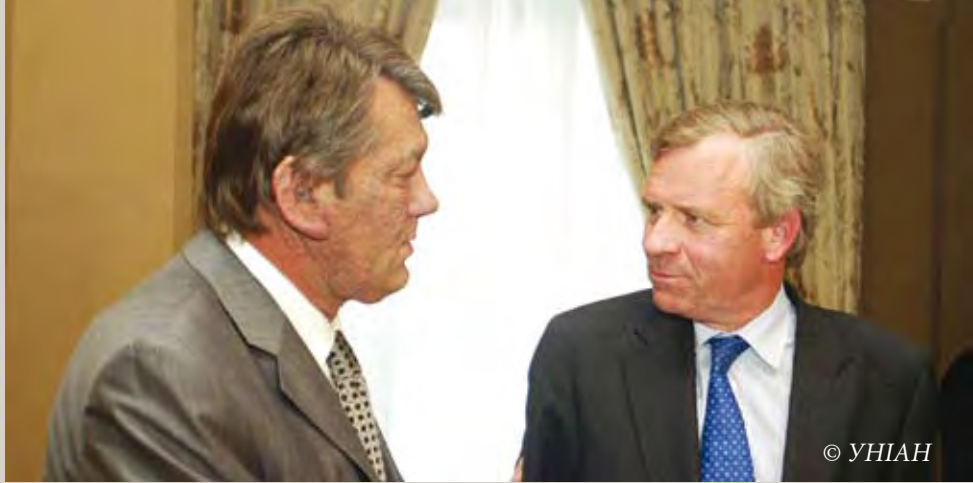
Зустріч у Києві, 27 червня 2005 року. Президент Віктор Ющенко та Генеральний секретар НАТО Яап де Хооп Схеффер (праворуч) обговорюють початок Інтенсифікованого діалогу.

У 2007 році Україна та НАТО відзначають десяту річницю підписання Хартії про Особливе партнерство. Хартію було підписано лідерами країн – членів Альянсу та України під час зустрічі на найвищому рівні у Мадриді в липні 1997 року. У документі визначено сфери консультацій та співпраці, а також схвалено створення Комісії Україна – НАТО, яка має спрямовувати розвиток відносин.